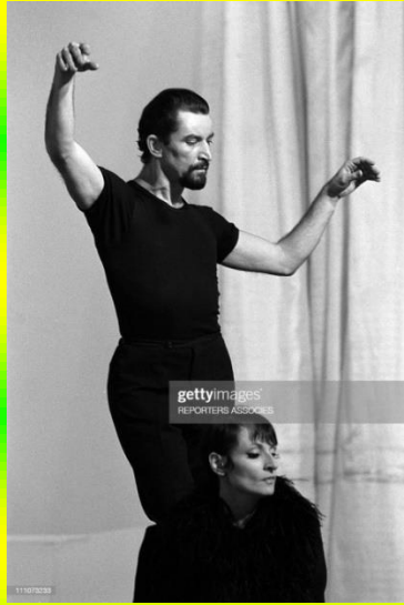
Müzisyen Maurice Bejart

Kur'an öyle bir ilâhi kelâmdır ki, onda Müzisyen olan Müziğin, Matematikçi olan Matematiğin, Edebiyatçı olan Edebiyatın gerçek inceliklerini,... , görür ve hisseder... Kısacası o kitap her okuyana, kendinden ve kendi bilim ve sanâtından, değişmeyen sırlar fısıldar.